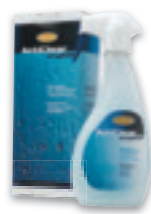
SPRAY ACTICLEAR CRYSTAL