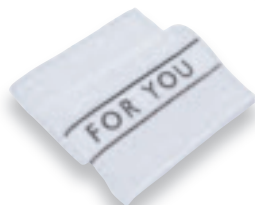
BATH TOWEL 110X60